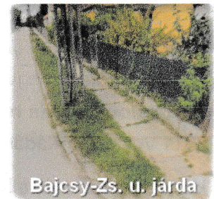
Bajcsy-Zs. u. járda