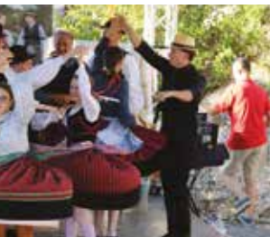
Minden pillanat nagy élmény