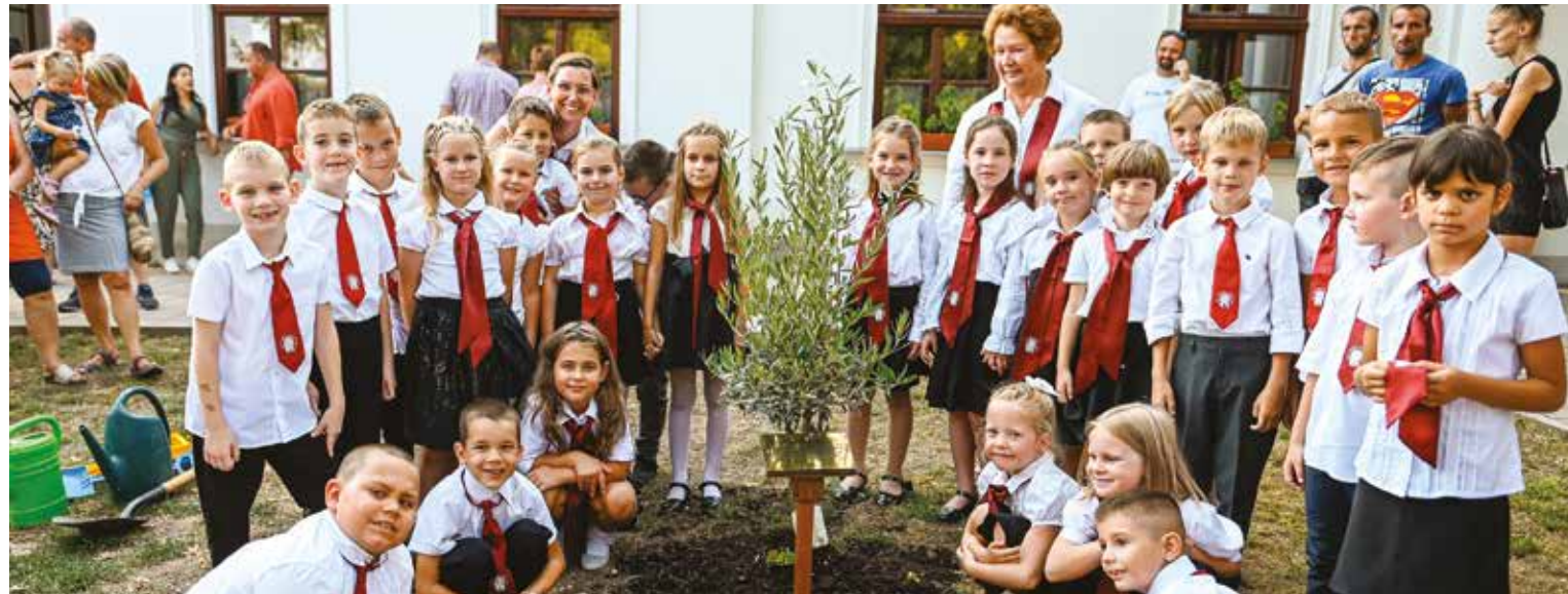
A gyermekek izgalommal várták a becsengetést