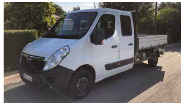
A régi teherautót jobb állapotúra cseréltük

– Miközben a diákok a nyári szünetüket töltötték, az iskolánál a bizton-