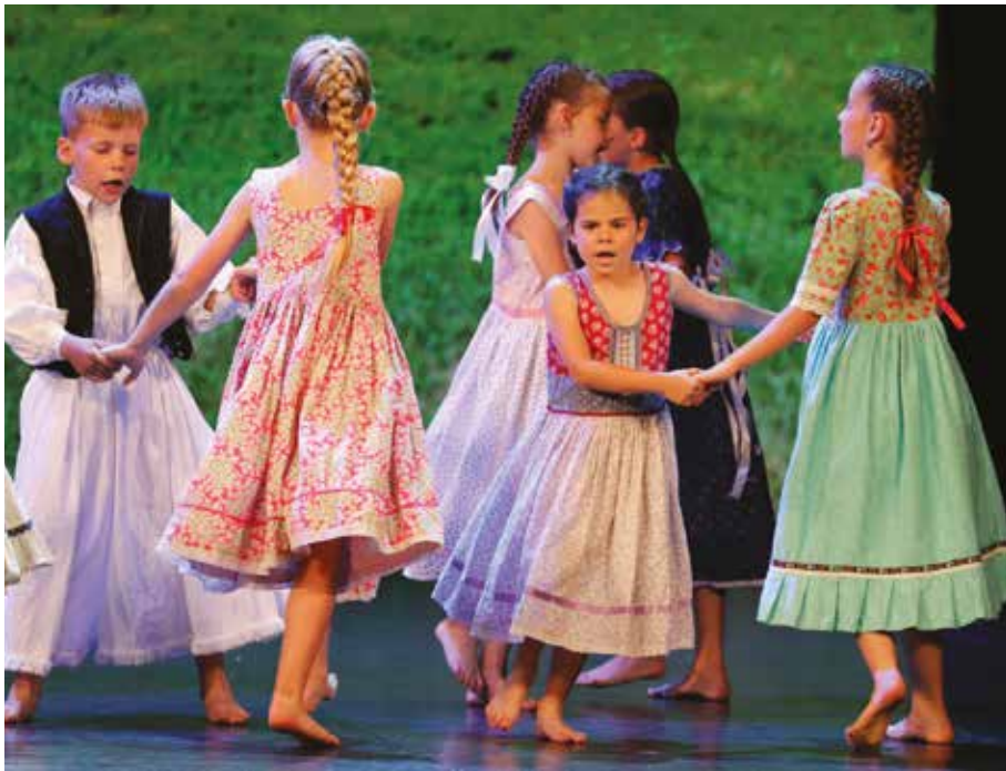
Immár a harmadik generáció tagjai is színpadra léptek