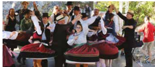
Minden pillanat nagy élmény