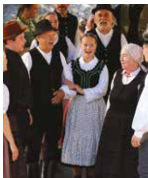
Nagyszülők, szülők hozzák unokáikat, gyerme-

Mára elmondhatjuk, hogy a Zöldág története három generációt ölel fel.